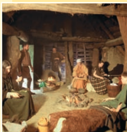
Nachgestellte Alltagsszene einer keltischen Familie

Die archäologische Abteilung zeigt einen Überblick über heimische Kulturen von der Steinzeit bis ins frühe Mittelalter. Dabei wird deutlich, dass die geographisch günstig gelegene und äußerst fruchtbare Landschaft der Wetterau durch die Zeiten eine kulturgeschichtlich bedeutende Rolle spielt.