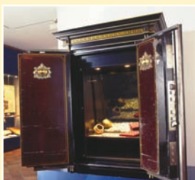
Römischer Münzschatz in Gründerzeit-Tresor

Kunst in der Sekundarstufe 1 und 2. Die Beschäftigung mit der Geschichte und Kultur der eigenen Stadt und Region bildet eine entscheidende Grundlage. Allgemeine geschichtliche Themen können am heimischen Beispiel konkret und nah an der eigenen Lebenswelt vermittelt werden. Durch nichts zu ersetzen ist beim Museumsbesuch der unmittelbare Kontakt mit originalen materiellen Zeugnissen unserer Geschichte und Kultur. Die Möglichkeiten der Vermittlung sind vielfältig und altersgerecht: neben der klassischen Führung reicht das Spektrum von der spielerischen Erkundung über Workshops, Fragebögen und Aufgaben bis zur Projektarbeit. Themen und Herangehensweise können im Vorfeld mit den Museumsmitarbeitern individuell abgestimmt werden.